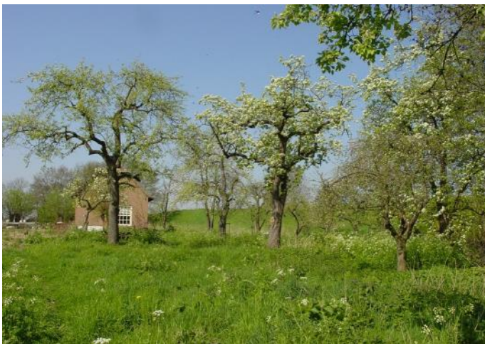
Boomgaardje met bloeiende bomen

De bloesem trekt hommels, bijen en vlinders aan, die voor de bestuiving zorgen. In oude hoogstamfruitbomen ontstaan holten, waarin soorten als steenuil en gekraagde roodstaart kunnen broeden. Een mooie haag om de boomgaard maakt het landschap nog aantrekkelijker. Een gemengde haag biedt extra mogelijkheden als nestgelegenheid voor vogels.